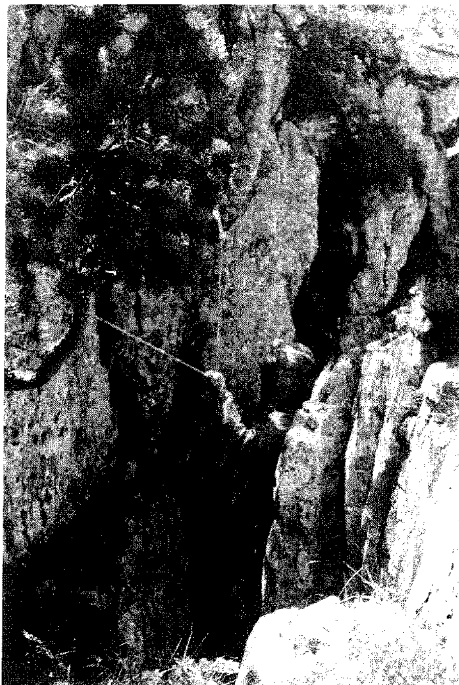
Entrée du AC 210 - Lées-Athas (Pyrénées Atlantiques) Stage explo 1999